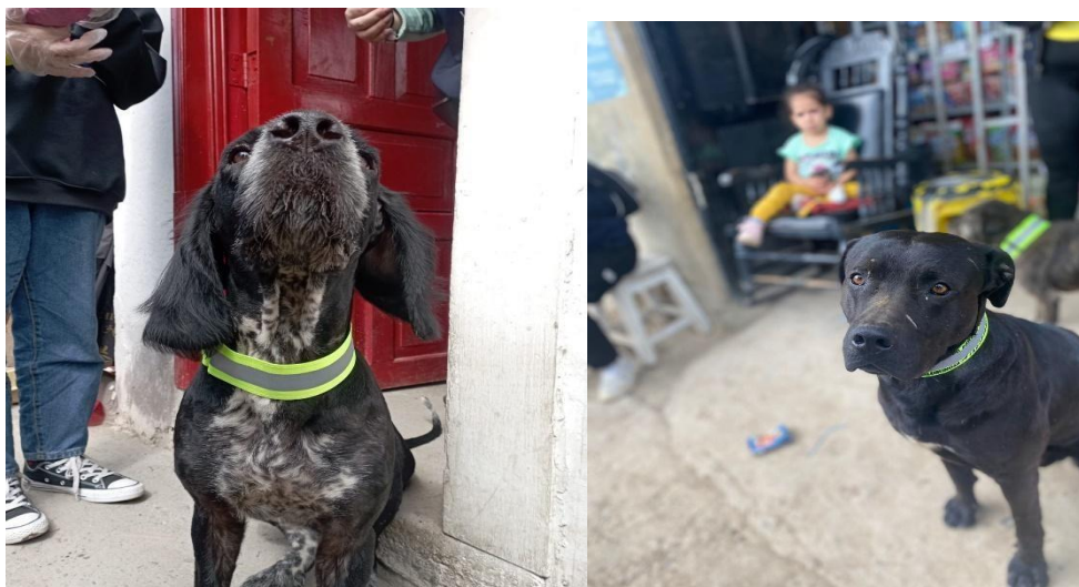
Foto 1: Collar de vida, reflectivo y marcado con la frase "No estoy perdido, busco un hogar, ADÓPTAME"