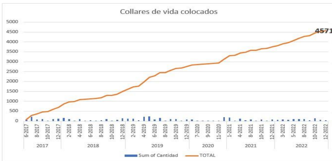
Gráfica 1: Evolución total de colocación de collares desde el inicio de Arca Luminosa