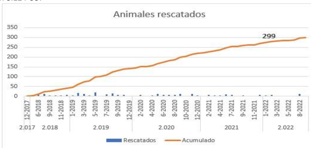
Gráfica 3: Evolución total de animales rescatados desde el inicio de Arca Luminosa

Con el total de los 29 rescates realizados para el 2022 la Fundación llega al número de 300 animales rescatados durante los años de actividad, para lo cual ha realizado una inversión total a este pilar de 271.878.124 COP